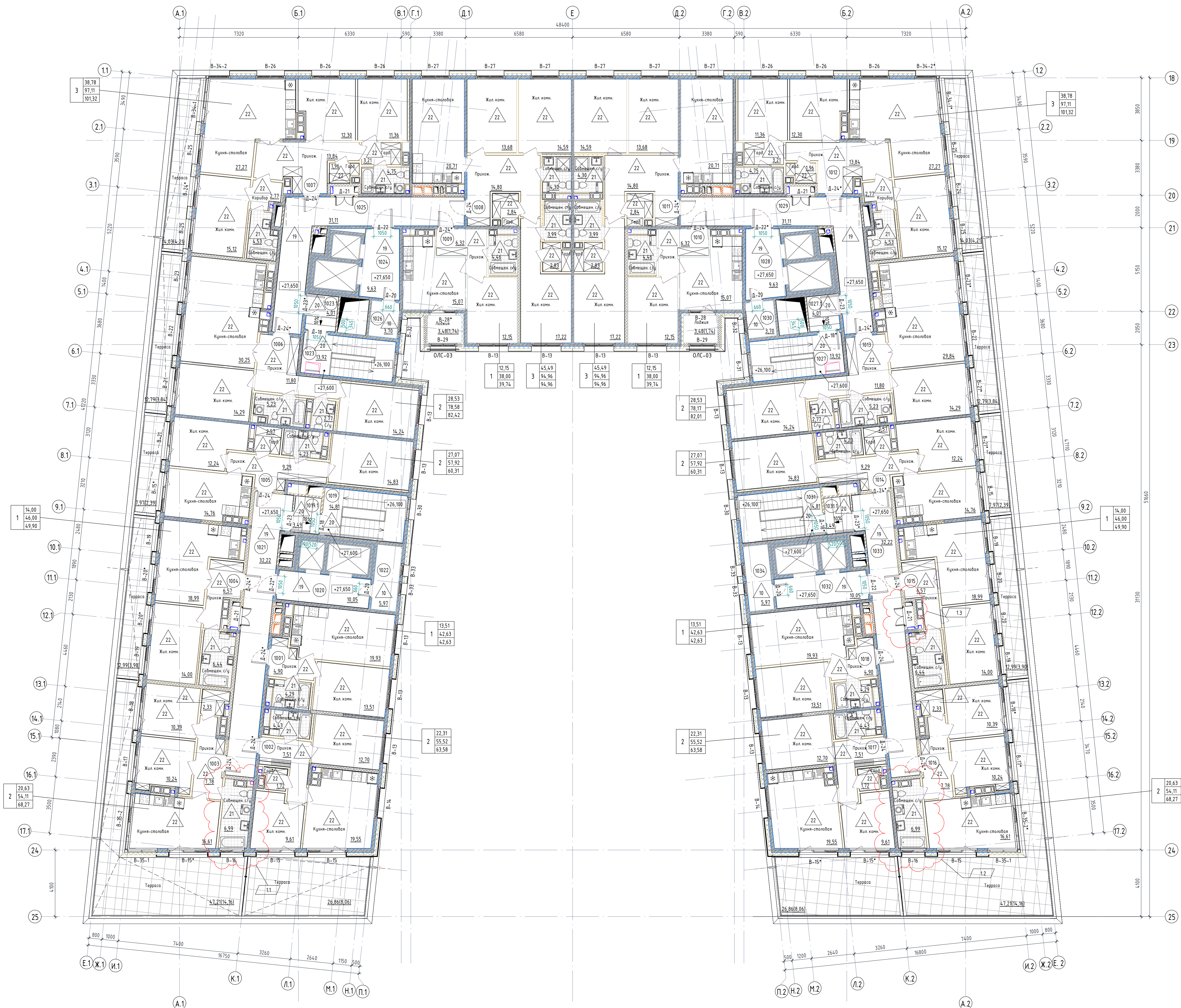
Отделочный план 10-го этажа (1:100)